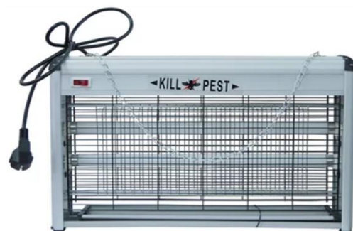
Рисунок 1. Способы получения информации с полей о количестве и фазе развития насекомых вредителей: